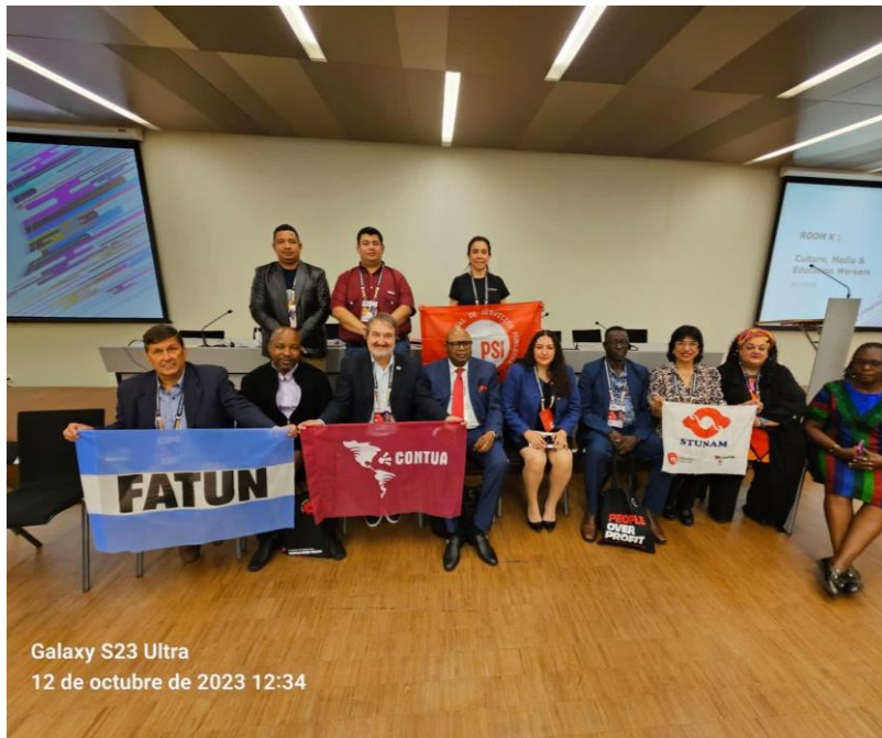
Galaxy S23 Ultra 12 de octubre de 2023 12:34